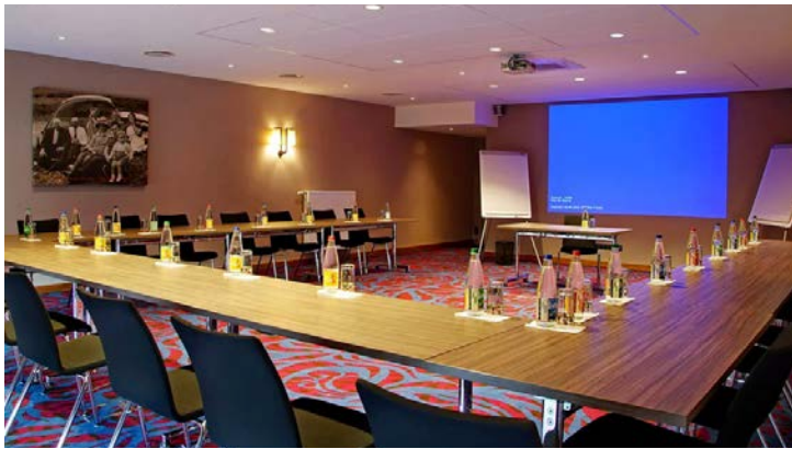
LA SALLE MARIETTE

Une offre exclusive pour laquelle des espaces comme la salle Mariette sont dédiés pour des RÉUNIONS STUDIEUSES OU INFORMELLES .