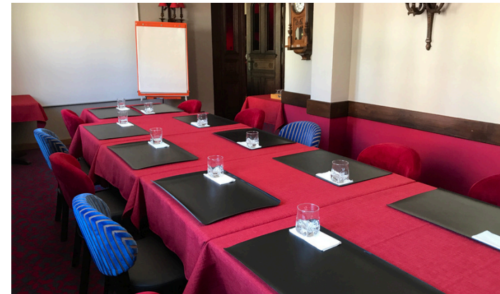
LA SALLE PREMIER